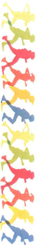
Tableau des Courses

Récompense : Un T-Shirt à tous les participants du 10km, Une coupe aux 3 premiers de chaque catégorie. Une récompense à tous les enfants.